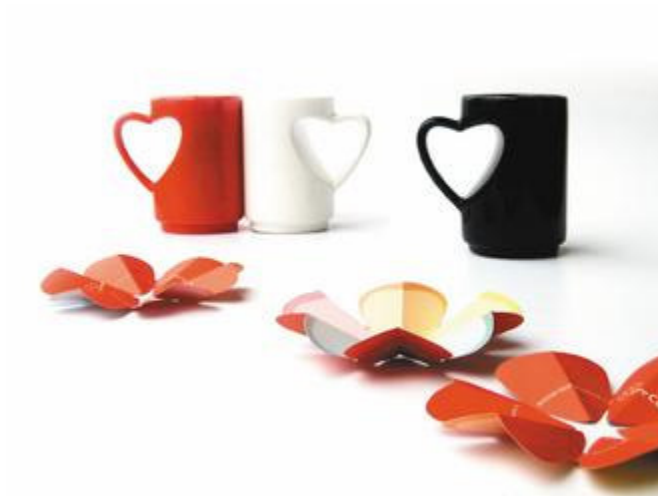
立體造型的愛心杯。

台灣瓷器設計已是相當成熟的設計商品，不但製作水準已能與歐洲名牌相提並論。有的品牌強調原創創意和國際視野，如法藍瓷、工藝所自創品牌「易」(Yii)等，有的作品則融入幽默創意，如Motor Design，也有的瓷器品牌主打東方禪意，自成一格，如suiiis、The One等。