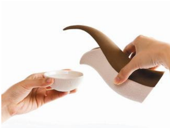
充滿東方禪的李白詩意。

台灣瓷器設計已是相當成熟的設計商品，不但製作水準已能與歐洲名牌相提並論。有的品牌強調原創創意和國際視野，如法藍瓷、工藝所自創品牌「易」(Yii)等，有的作品則融入幽默創意，如Motor Design，也有的瓷器品牌主打東方禪意，自成一格，如suiiis、The One等。